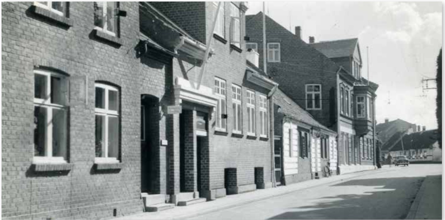
I kælderen i ejendommen Mogensgade 4, (med kælder-vinduerne) havde Kunstforeningen sit eget første galleri. Men lokalerne var ikke gode. Der manglede det rigtige lys. Lokalerne blev efterfølgende brugt af pottemager Gabel, og blev så revet ned, da Grenaa's nyeste rådhus skulle bygges med åbning i 1980.

Nielsen omkom ved en drukneulykke få måneder efter foreningens stiftelse. Demokratens redaktør var dybt engageret i den socialdemokratiske bevægelse: Parti og fagbevægelse, der i 1940'erne stort set var "ét".